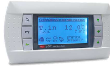
Painel com indicador de Temperatura à distancia Até 30 mts