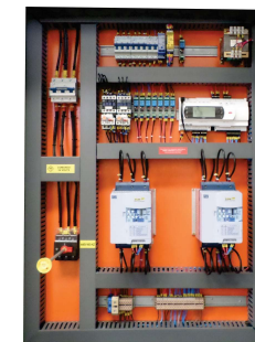
Partida em Rampa Com soft Strater