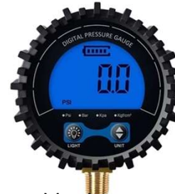
Manômetro Indicação de Pressão de Água/Gás