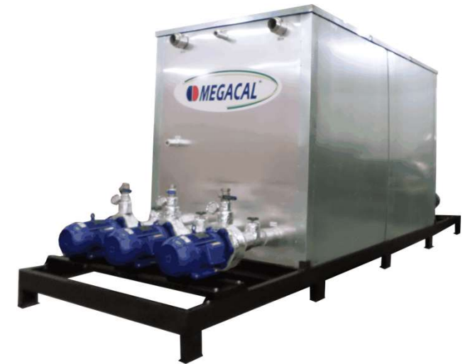
Sistema com até 4 bombas de Água