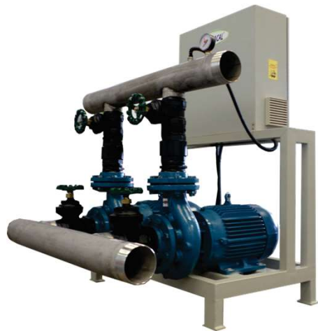
Sistema de Bombeamento Sem reservatório de Água