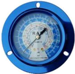
Manômetro Indicação de Baixa pressão