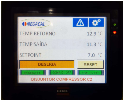
Painel - CLP