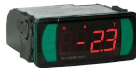
Termostato de Segurança Digital