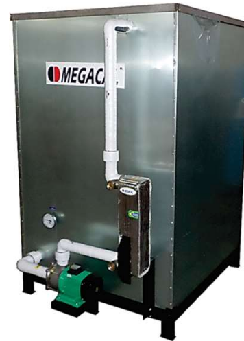
Sistema com trocador de E Bomba de circulação de Água