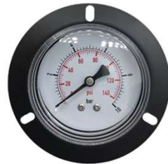
Manômetro Indicação de Pressão de Água