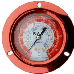
Manômetro Indicação de Alta pressão