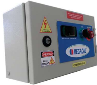
Painel com indicador de Temperatura à distancia