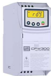
Inversor de Frequência