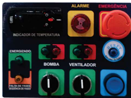
Painel de Controle Em Português