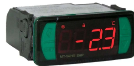
Termostato de Segurança Digital