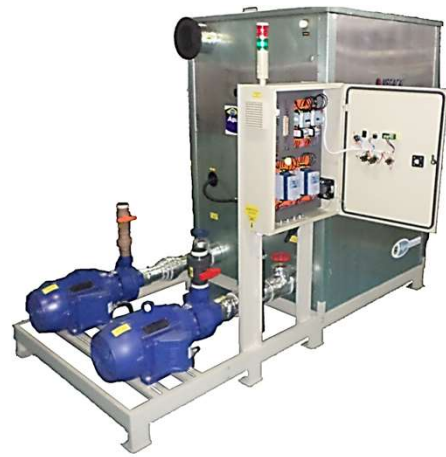
Sistema com Reservatório Bomba de água e quadro elétrico