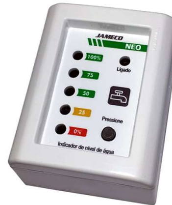
Nível de Água para reservatório