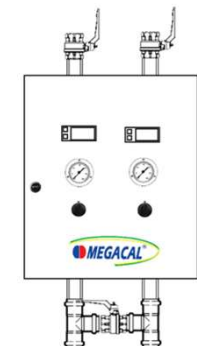
Painel de Fluxo de Líquidos