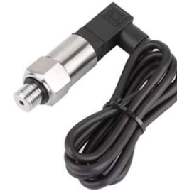
Transdutores de Pressão