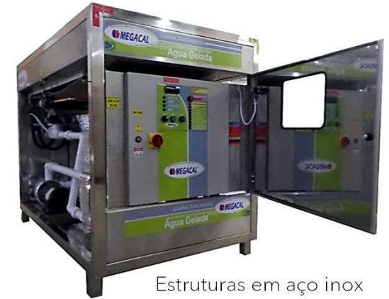
Estruturas em aço inox Especiais