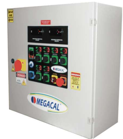
Quadro elétrico para partida de bombas E CONTROLE DE PROCESSOS