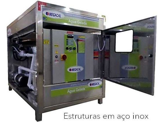
Estruturas em aço inox Especiais