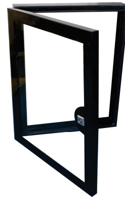
Porta Avulsa Para quadro elétrico