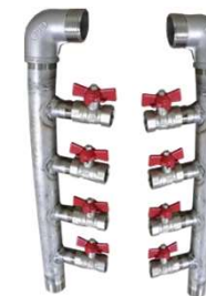
Distribuidor de Água ate 8 vias